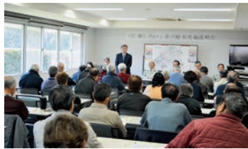
広報全戸配布説明会