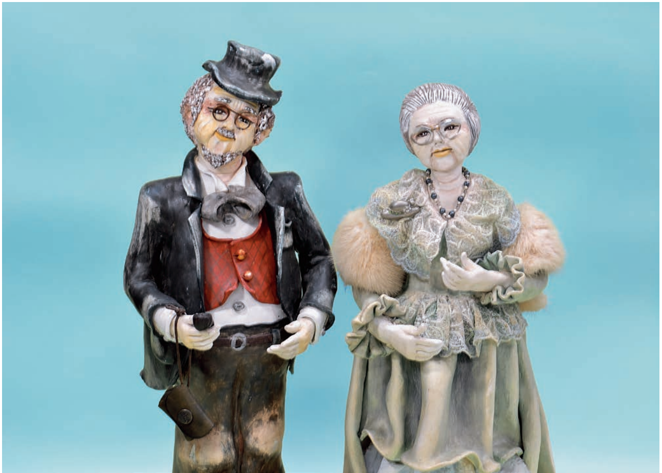
「活きがい」 (渡部厚子会員制作)