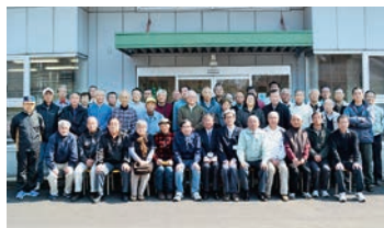
広報全戸配布会員

不全な状態とならないよう適正な管理を進めることにより、良好な生活環境の保全及び安全で安心な街づくりに寄与することを目的にしています。