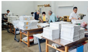
広報全戸配布仕分け作業